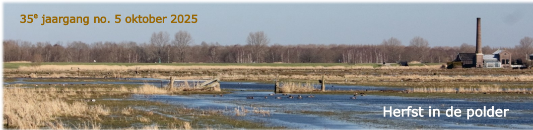
Herfst in de polder