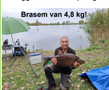
Brasem van 4,8 kg!