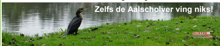
Zelfs de Aalscholver ving niks!

Al met al weer een geslaagde afsluiting van het wedstrijdseizoen aan de plas. Alle vrijwilligers en vissers bedankt voor de inzet en gezelligheid!