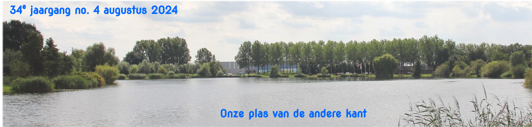
Onze plas van de andere kant