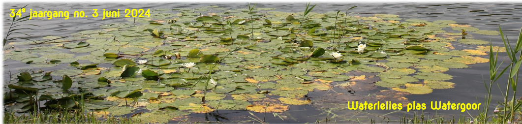
Waterlelies plas Watergoor