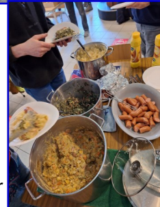
Pier en Wipper