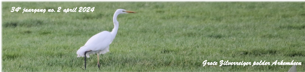
Grote Zilverreiger polder Arkenveen