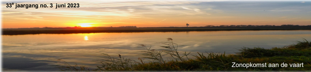
Zonopkomst aan de vaart