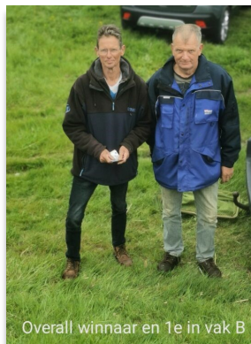
Overall winnaar en 1e in vak B

Koningsdag 27 april hielden we een koppelwedstrijd aan de Eem. De deelname was teleurstellend te noemen op de verder geslaagde dag. Onder mooie weersomstandigheden gingen we om 9 uur van start en stroomde de Eem richting Randmeer wat meestal garant staat voor een goede vangst. Maar op deze morgen gebeurde er na het beginsignaal bar weinig in het eerste uur. Alleen op de kop en staartnummers werd een enkele vis gevangen, of sloeg men een lijnzwemmer aan welke meestal verloren ging.